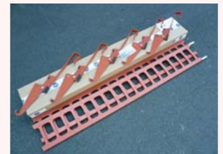
Das Komplettpaket: 2 x profiliertes Schneefanggitter 5 x Schneefangstützen Nr. 76 b Schrauben M 8 x 20 + Muttern 4 x Verbindungsuffen