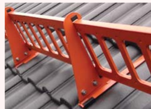
profilierter Schneefang: robust und stabil