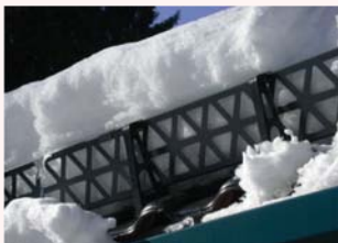
Royal-Color: edel und extravagant