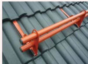
Doppelrohr-Schneefang: innovativ und modern