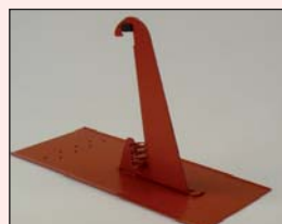
Schneefangstütze Nr. 175 für Schneefanggitter