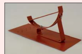
Laufroststütze Nr. 190 für Laufroste