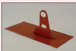
Schneefangstütze Nr. 173 für Alu-Rohr 32 mm Ø

platzsparende Lagerhaltung in hochwertigen FLENDER-FLUX-Standardfarben