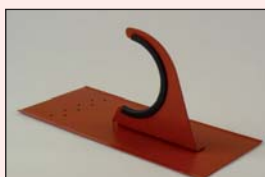
Schneefangstütze Nr. 174 für Alu-Rohr 120 mm Ø